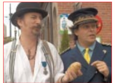
Comédiens du Magic Land Théâtre (spectacle du Musée de la Belgitude)