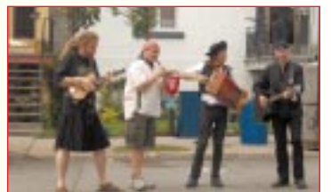
Groupe Cré Tonnerre qui a animé la soirée Wallonie-Bruxelles à compter de 21 heures