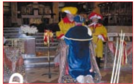
Intronisation du représentant de la Confrérie des Mollassons de Warnant dans la Confrérie des Sarrasins.