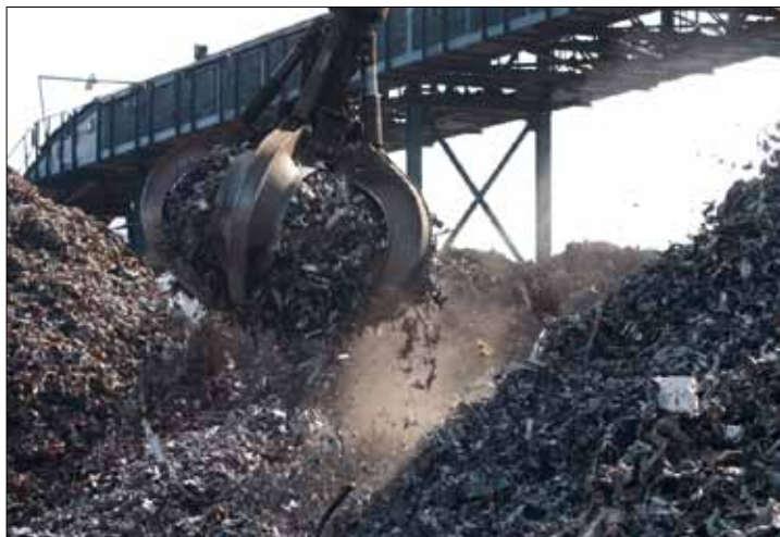
Manutention de ferraille sur le site d'Obourg