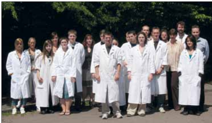
L'équipe de Viridaxis, 25 scientifiques aux compétences pointues, s'agrandit chaque année.

Pour produire des parasitoïdes, Viridaxis leur fournit, en quelque sorte, de faux pucerons. La société est détentrice d'un brevet exclusif quant à l'utilisation de capsules en biopolymère à base d'extraits de poudres de crustacés et d'algues, reproduisant la physiologie du puceron. Grâce à un ingénieux jeu d'odeurs, le parasitoïde n'y voit que du feu et pond à l'intérieur de la capsule. La