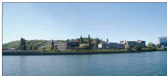
Le site du Val Benoît

qui ne sont pas utilisées à leur pleine capacité seront densifiées comme par exemple à Liège, le site du Val Benoît, campus des Sciences appliquées de l'université jusqu'en 1990. Il se compose de plusieurs bâtiments à l'architecture remarquable qui vont être réaffectés, complétés par de nouvelles constructions, des espaces d'accueil, de services, etc. Le site sera traversé par une coulée verte, dans un aménagement orienté vers le développement durable.