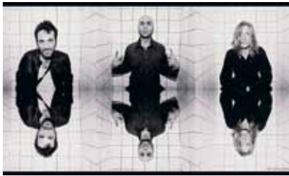
Experimental Tropic Blues Band