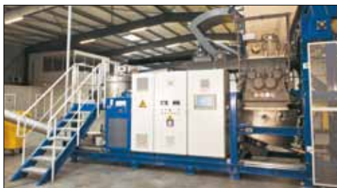
Machine AMB de taille moyenne (série 125 Ecosteryl)

traitement des déchets issus du monde médical. Les machines exportées par AMB utilisent le procédé breveté Ecosteryl afin de décontaminer les déchets d'activités de soins à risques infectieux (DASRI). Le traitement consiste à les broyer, puis les garder à