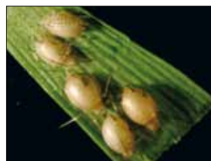
Les momies sur la feuille.