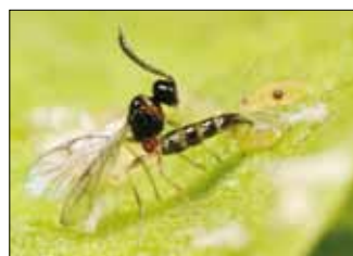
Une mini-guêpe parasitant un puceron.

Viridaxis a choisi de s'installer à Charleroi dans le Parc d'activité du Centre d'entreprises Héraclès et déménagera bientôt vers l'Aéropôle de Gosselies. Grâce à sa technologie