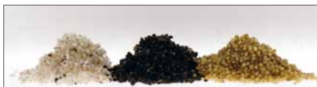
Les différentes momies composant FresaProtect, un cocktail qui s'avère très efficace : une femelle peut pondre des centaines d'œufs en seulement quelques jours. FresaProtect est utilisé dans la lutte biologique, mais surtout dans des stratégies 'intégrées' en remplaçant des insecticides contre les pucerons.

brevetée, elle produit des insectes parasitoïdes en masse, principalement différentes espèces de mini-guêpes de 2 à 3 mm de long. Certaines espèces trouvent leurs cibles dans les cultures de concombres, melons, pastèques, poivrons, aubergines, tomates, haricots, fraises, arbres fruitiers. Certains produits de Viridaxis sont des cocktails de plusieurs espèces de parasitoïdes, spécialement élaborés pour un type de culture en particulier : FresaProtect pour protéger les fraises, BerryProtect pour les baies,