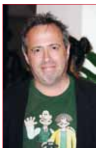
Jaco Van Dormael

Profitant de la venue de Jaco Van Dormael dans le cadre de la présentation de Kiss & Cry , la Cinémathèque québécoise présentera du 26 au 29 avril trois des films qui ont fait la renommée de ce réalisateur. Il s'agit de Toto le héros (26 avril, 18h30), Le Huitième jour (28 avril, 16h) et Mr. Nobody (29 avril, 16h30). Cette dernière projection sera précédée, à 16h, d'une rencontre avec le public. C'est un rendez-vous!